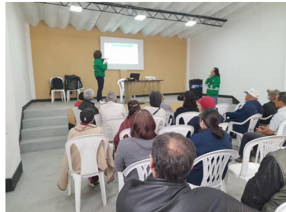
Figura 5. Presentación propuesta actualización zonificación ambiental y plan de acción humedal de Techo el 05/05/2023.