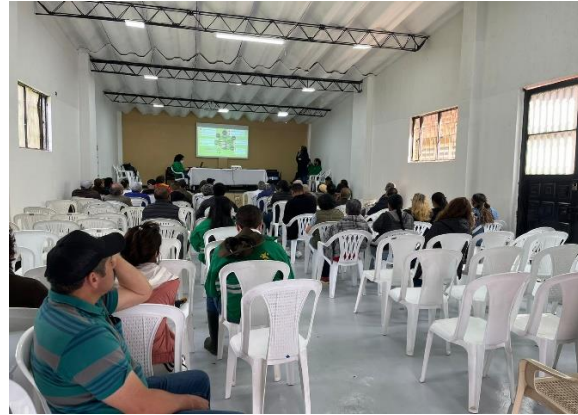
Figura 4. Taller diferencial comunidad Lagos de Castilla II. humedal de Techo 05/11/2022. Fotografía de Jhoseph Rodríguez, 2022. SPPA – SDA, 2022.