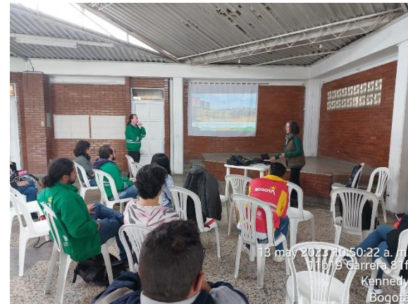
Figura 6. Presentación propuesta actualización zonificación ambiental y plan de acción humedal de Techo el 13/05/2023. Fotografías de María Alejandra Piedra, SPPA - SDA, 2023.

Los aportes, propuestas, percepciones y solicitudes presentadas por la ciudadanía y organizaciones comunitarias que participaron en el proceso de actualización del PMA,