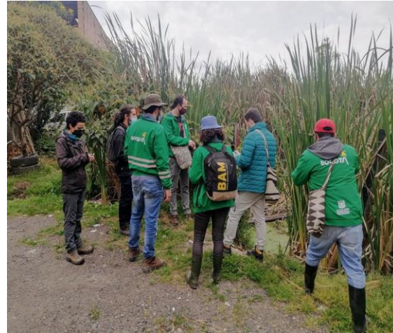
Figura 1. Visita reconocimiento de campo en el humedal de Techo 17/02/2022. Fotografía de Jhosep Rodríguez, SPPA - SDA, 2022.