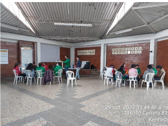
Figura 3. Taller participativo capítulo de evaluación humedal de Techo 29/10/2022.