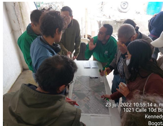
Figura 2. Taller participativo capítulo de descripción en el humedal de Techo 23/07/2022.